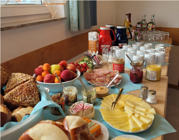
Mitarbeiter:innen Frühstück in Crailsheim