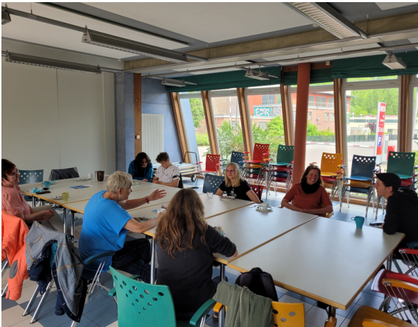
Mitarbeiter:innen Frühstück in Schwäbisch Hall