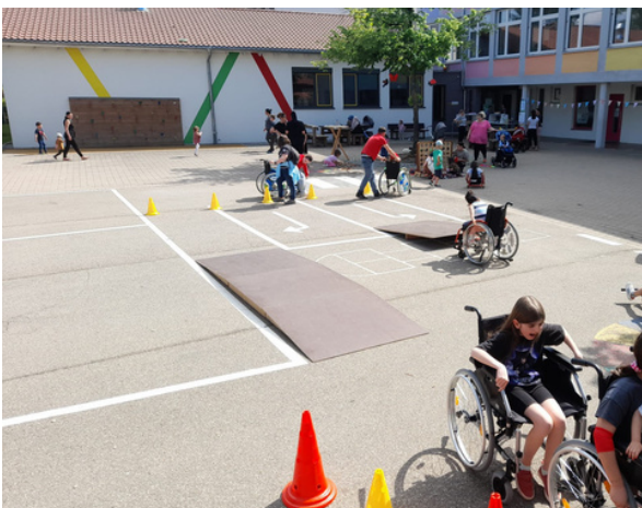
Spielmobil - Rollstuhlparkour